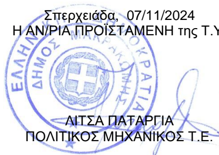
ΛΙΤΣΑ ΠΑΤΑΡΓΙΑ ΠΟΛΙΤΙΚΟΣ ΜΗΧΑΝΙΚΟΣ Τ.Ε.

Σπερχειάδα, 07/11/2024 Η ΑΝ/ΡΙΑ ΠΡΟΪΣΤΑΜΕΝΗ της Τ.Υ.