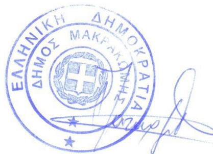
ΛΙΤΣΑ ΠΑΤΑΡΓΙΑ ΠΟΛΙΤΙΚΟΣ ΜΗΧΑΝΙΚΟΣ Τ.Ε.

Σπερχειάδα, 28/06/2022 Η ΑΝ/ΡΙΑ ΠΡΟΪΣΤΑΜΕΝΗ της Τ.Υ.